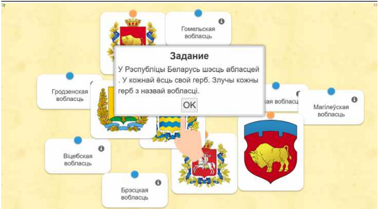
Малюнак 2. – Скрыншот старонкі інтэрактыўнага плаката “Беларусь – мая старонка”