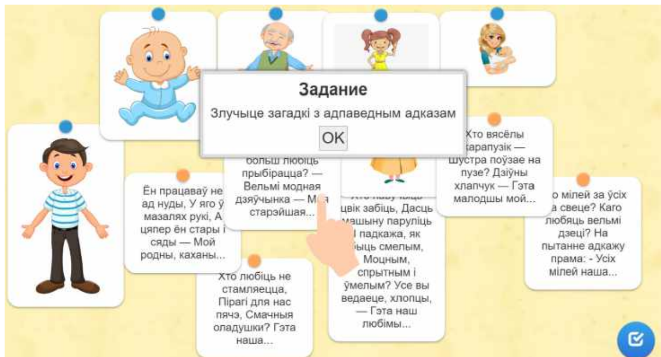
Малюнак 1. – Скриншот старонкі інтэрактыўнага плаката “Сям’я”