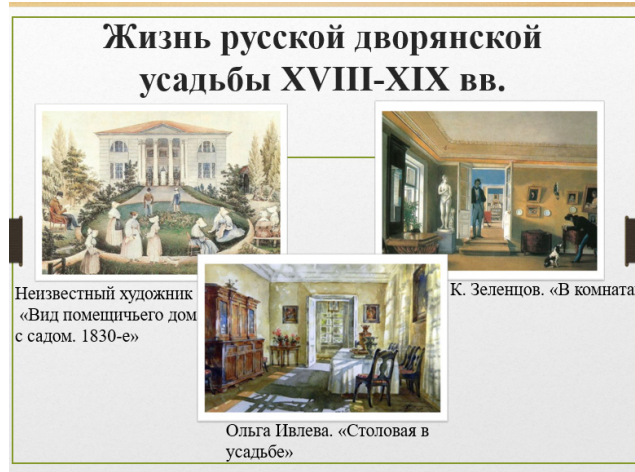
Рисунок 3. – Слайд 9

Предлагаю вам поработать в группах: зелёные