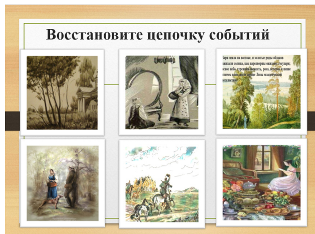
Рисунок 4. – Слайд 11

Задание группе «филологов»: восстановите цепочку событий повести, расположив номера иллюстраций в правильном порядке (слайд 11). (Рисунок 4).