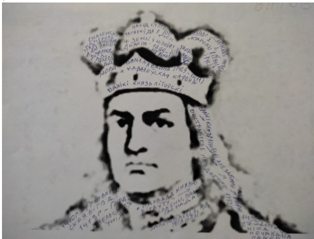
Рисунок 2. – Буквенный портрет князя Витовта

4. После заполнения портретов словами, сочетаниями слов учащиеся представляют то, что получилось, обсуждают, высказывают свое мнение о фактах, понятиях, которые ими были использованы при работе над портретами, тем самым проводится закрепление усвоенных понятий.