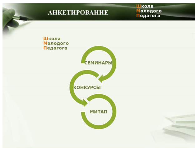
Рисунок 4. – Схема взаимосвязи форм сопровождения

В соответствии с планом работы Школы молодого педагога организационно-методическое сопровождение педагогов со стажем работы до трех лет осуществляется через комплекс образовательно-мотивационных мероприятий. Развитие психолого-педагогических и предметно-методических компетенций, повышение уровня медиаграмотности и медиакультуры, устойчивой мотивации к педагогической деятельности, построение приемлемых моделей коммуникации молодых специалистов в ученическом и педагогическом коллективах – ключевые направ-