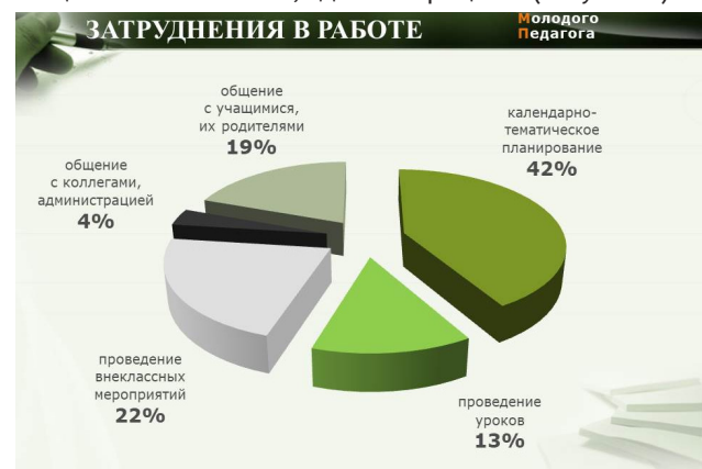
Рисунок 1. – Диаграмма профессиональных затруднений

В педагогической деятельности молодые педагоги испытывают затруднения по следующим направлениям: 42% – составление календарно-тематического планирования, 22% – проведение внеклассных мероприятий, 19% – общение с учащимися и их законными представителями, 13% – проведение уроков, 4% – общение с коллегами, администрацией. (Рисунок 1).