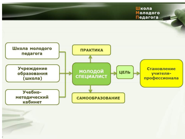
Рисунок 2. – Схема трехуровневой поддержки

одолении затруднений, развитии профессиональных компетенций, активизации профессионального роста молодой учитель может получить на уровне учреждения образования (школы), районного учебно-методического кабинета, областного института развития образования. (Рисунок 2).