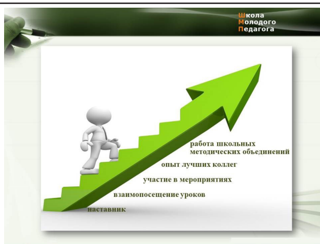
Рисунок 3. – Формы наставничества

Работа с молодыми педагогами является одной из самых важных составляющих деятельности методической службы на уровне района. Овладение ос-