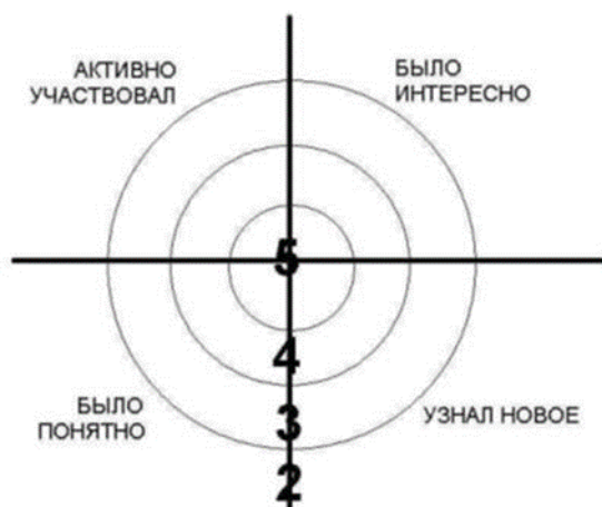
Рисунок 3. – Рефлексивная мишень

Учащимся предлагается выйти к доске и поставить метки в сектора мишени соответственно оценке собственного результата работы на уроке (рисунок 3).