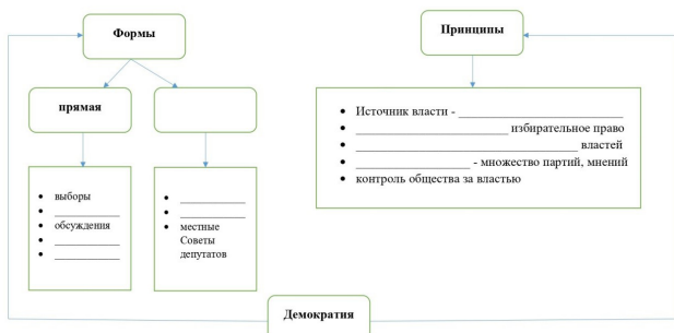
Рисунок 1. – Образец филворда, схемы на рабочем листе