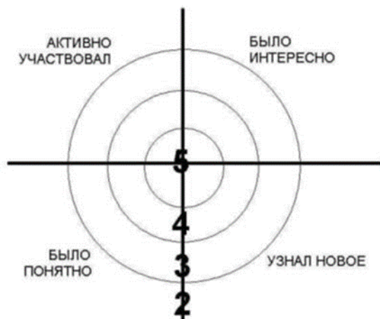
Рисунок 3. – Рефлексивная мишень

Учащимся предлагается выйти к доске и поставить метки в сектора мишени соответственно оценке собственного результата работы на уроке (рисунок 3).