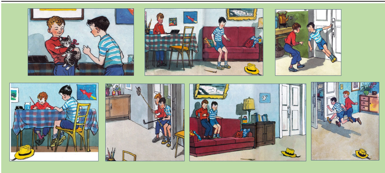
Рисунок 5. – Упражнение «Составь план»

ко лучше понять героя, мотивы его поступков, но и обогатить лексический словарь учащихся. На уроке учащимся предлагается подобрать слова-характеристики для главных героев произведения. В зависимости от уровня субъектных знаний учащихся задание варьируется. Учащиеся распределяют подходящие слова для героев из предложенных. Данный вариант выполнения задания позволяет активно использовать межпредметные связи (рисунок 4).