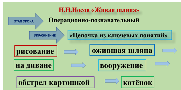
Рисунок 3. – Упражнение «Цепочка из ключевых слов»

ний предлагаю нераспространенные предложения, учащимся со средним уровнем – распространенные