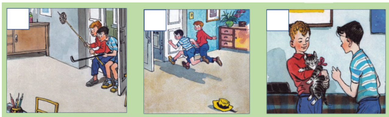
Рисунок 1. – Дидактическая игра «Выбери картинку»

На ориентировочно-мотивационном этапе урока можно предложить учащимся вариации приема «Ассоциация». Цель приема – создание положительной мотивации к изучению произведения. Материалом могут служить изображения главных героев расска-