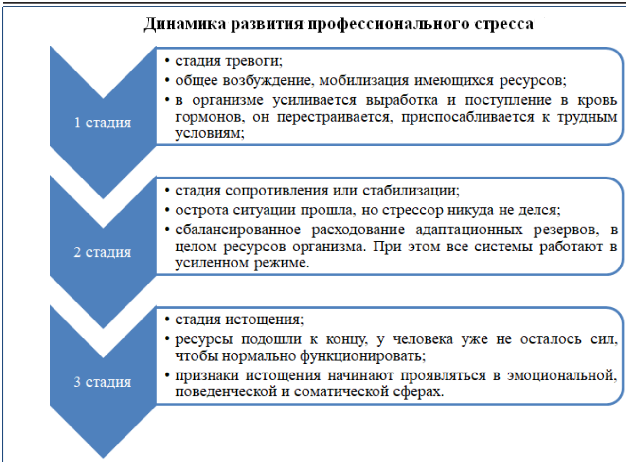
Рисунок 6. – Пример представления информации по управлению стрессом в первом разделе рабочей тетради

как предметных, так и метапредметных компетенций. Задания предполагают работу с лекционным материалом, методическими пособиями, а также учет своего педагогического опыта; составляются таким образом, чтобы педагог мог при необходимости сделать подобные для своих учащихся. Такая организация материала в ПРТ позволяет расширить и углубить содержание программы повышения квалификации, выявить пробелы, найти точки роста и, как итог, спроектировать свою индивидуальную образовательную траекторию.