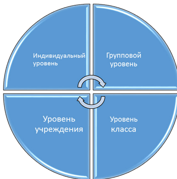
Рисунок 2. – Уровни психолого-педагогического сопровождения одаренных учащихся

Психолого-педагогическое сопровождение одаренных детей должно осуществляться на нескольких уровнях (рисунок 2).