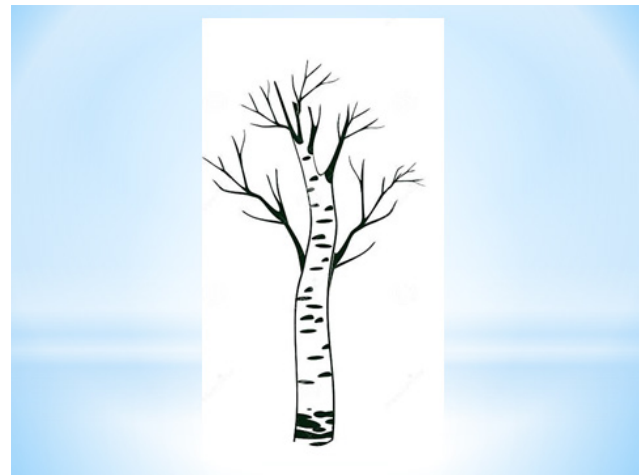
Рисунок 6. – Слайд 11

«Украшение» березки листочками – учащиеся прикрепляют к дереву листики, учитывая свою работу и достижения на уроке: чем лучше усвоен материал, тем выше прикрепляется листочек.