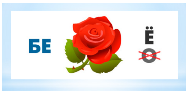
Рисунок 2. – Слайд 3

Разгадайте ребус, чтобы узнать, с каким словом будет связано чистописание. Слайд 3. (Рисунок 2).