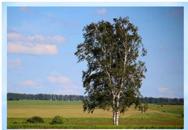
Рисунок 3. – Слайд 5

Что вы знаете о березе как о растении? ( Учащиеся по очереди ловят мяч и называют известные им факты о березе ).