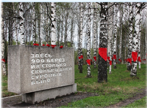
Рисунок 4. – Слайды 6–8

нах погибших в годы войны советских людей.