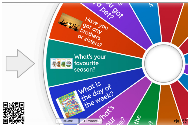
Рисунок 1. – Скриншот страницы

Let's spin the wheel and answer some simple questions.