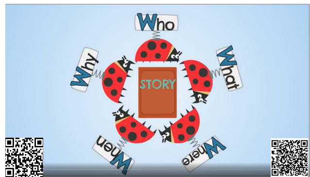
Рисунок 2. – Скриншот страницы

So let's recall our question words (рисунок 2) and sing the song (опора в виде флеш-карточек на доске).