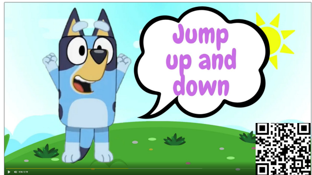
Рисунок 3. – Скриншот страницы

To my mind you 'are tired. Let's relax and have fun. Stand up and play the Simon says game (рисунок 3).